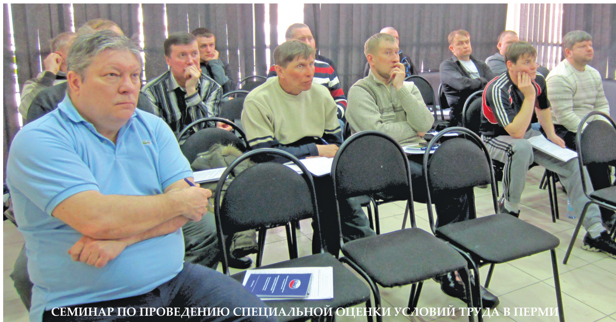
СЕМИНАР ПО ПРОВЕДЕНИЮ СПЕЦИАЛЬНОЙ ОЦЕНКИ УСЛОВИЙ ТРУДА В ПЕРМИ