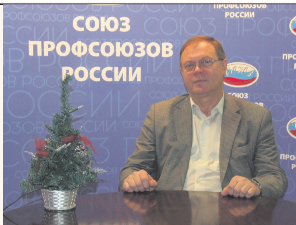
Генеральный секретарь СПР

Доброго здоровья в будущем году вам, вашим родным и близким. Пусть он принесет в вашу жизнь больше позитивных моментов!