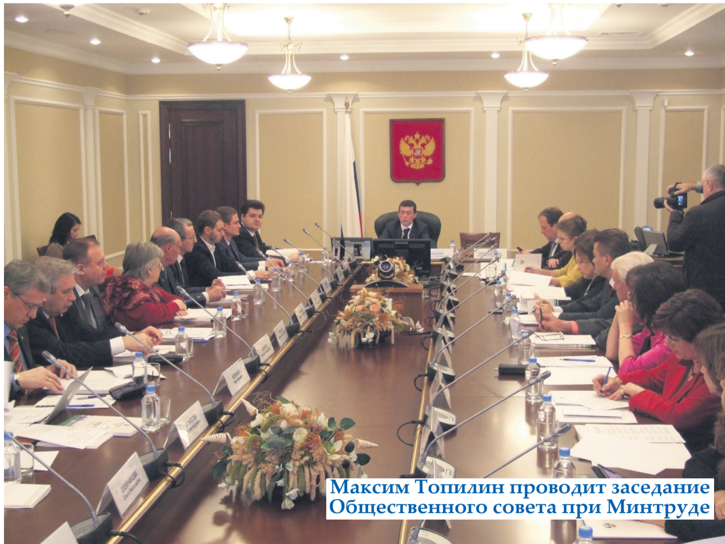
Максим Топилин проводит заседание Общественного совета при Минтруде

Первое заседание Общественного совета при Минтруде России состоялось 29 ноября 2013 г. В нем принял участие Генеральный секретарь Союза профсоюзов России Евгений Куликов