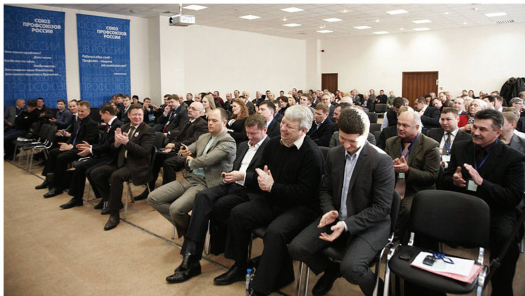
Съезд Союза профсоюзов России

Постановлением внеочередного Съезда Союза профсоюзов России (СПР) в 2012 году в качестве основной задачи, наряду с требованиями о росте доходов работников, как стимула для развития производства, определено законодательное закрепление соотношения тариф/премия 80/20 в структуре заработной платы как базовое для формирования работодателем системы оплаты труда на соответствующем предприятии.