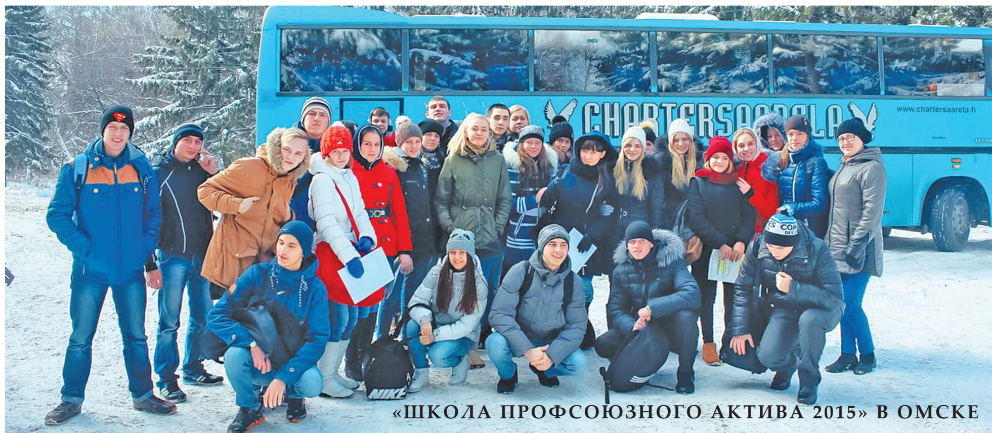
«ШКОЛА ПРОФСОЮЗНОГО АКТИВА 2015» В ОМСКЕ