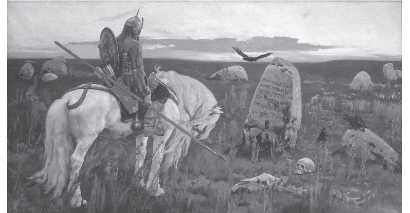
Витязь на распутье. 1882 г. Виктор Михайлович Васнецов

«Эффективность социальной политики государства измеряется