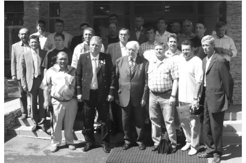
11 июля 2009 г. 20-летие начала массовых шахтерских забастовок. В центре последний министр угольной промышленности СССР М.И. Щадов. Вокруг ветераны рабочего шахтёрского движения из России, Донбасса (Украина), Караганды (Казахстан).

1) выплаты при гибели работника 1000 МРОТ, при тяжёлой травме 500 МРОТ;